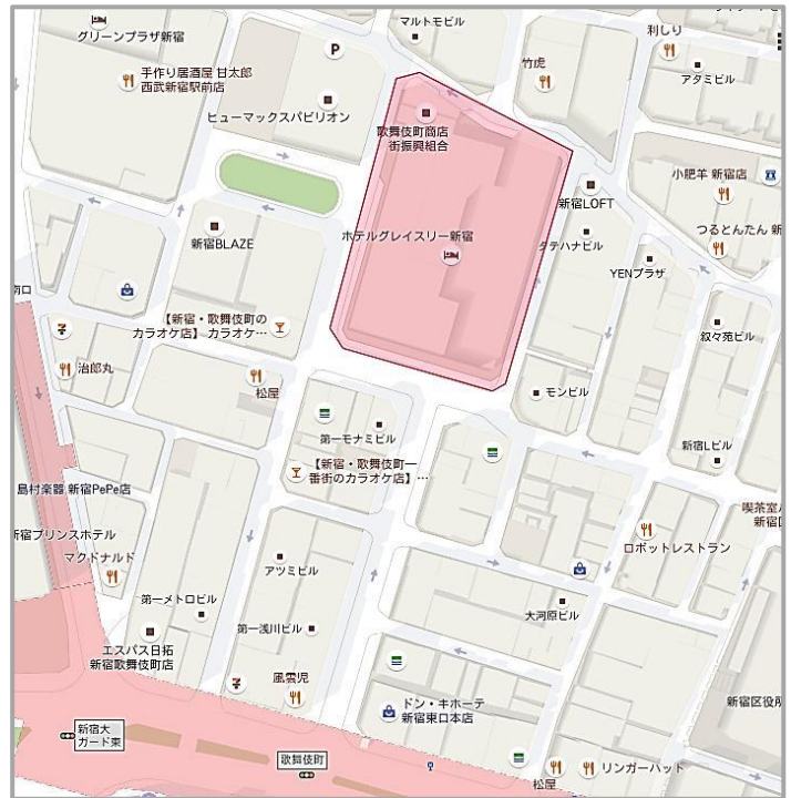
新宿東宝ビル周辺地図 拡大図