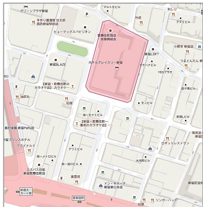
新宿東宝ビル周辺地図 拡大図