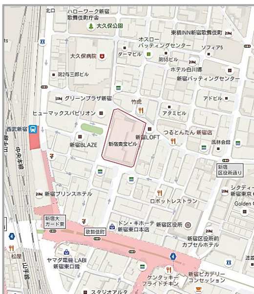
新宿東宝ビル周辺地図

※なお、この新宿東宝ビルの壁面を活用して得られる媒体収入は、歌舞伎タウン・マネージメントの 公益的事業の財源となり、歌舞伎町の賑わいと安全・安心なまちづくりのために活用されます。