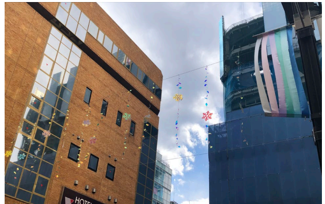
(2) シネシティ広場冬季装飾